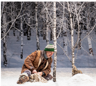
31/01 La Fausse Suivante - TNN