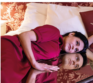
28/05 Le Rossignol - Les Mamelles de Tirésias - ONCA

Mardi : 13h > 18h Mercredi, vendredi et samedi : 10h > 18h