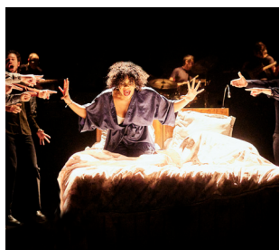
28/03 La force qui ravage tout - TNN