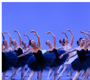
23/06 Gala de l'Académie - BMC