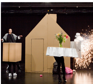
12/04 After All Springville - TNN