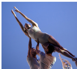
27/04 To the Point(e) - BMC

Vous souhaitez assister aux différents spectacles ?