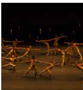
Ballets de Monte-Carlo (BMC)