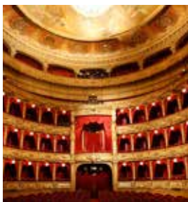
Opéra Nice Côte d'Azur (ONCA)