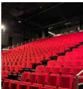
Théâtre National de Nice (TNN)